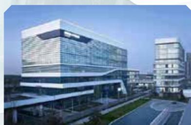
国际医学中心校区