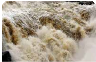
一水 · 黄河