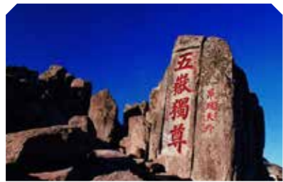
一山 · 泰山

山东中医药大学创建于 1958 年，1978 年被确定为全国重点建设的中医院校，1981 年成为山东省重点高校，是教育部本科教学工作水平评估优秀学校、山东省人民政府和国家中医药管理局共建中医药院校、山东省应用基础型人才培养特色名校、山东省省级文明校园、山东省高水平学科和高水平大学。学校在省属高校中拥有国家重点学科最多，首批获得硕士、博士学位授权，首批成为国家“973”项目首席承担单位，硕士点数量位居全国同类院校前列。在 2021 软科中国最好学科排名中，中医学位列第 6，中西医结合位列第 5，临床医学、药理学与毒理学进入 ESI 全球前 1% 行列。