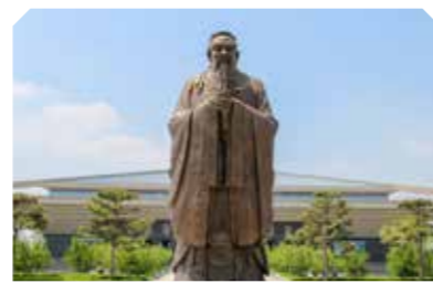
一圣人 · 孔子

学校秉承“厚德怀仁、博学笃行”的校训，充分发挥“儒医文化、扁鹊故里、针灸发源地”“三张名片”优势，塑造独具特色的大学文化品格。